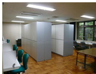
オフィス内の様子