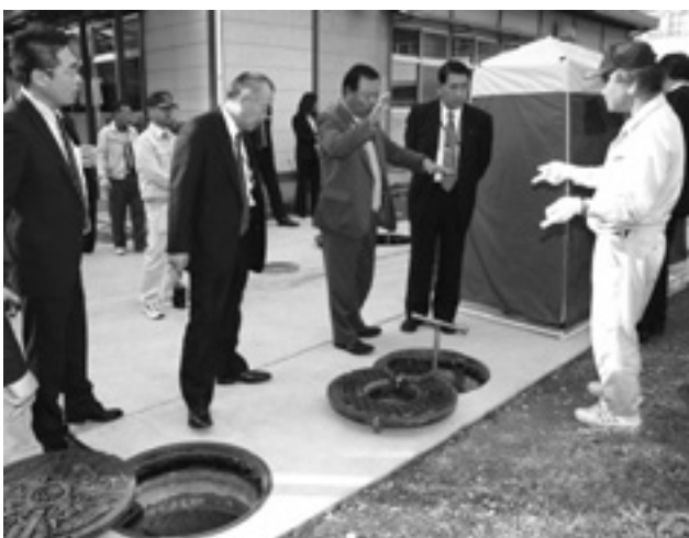
▲東日本大震災の被災地である宮城県石巻市から議員団の視察(平成24年11月)

マンホールトイレの整備は、全国でも先進的な取り組みとされ、他都府県から視察があります。東日本大震災以降、被災地である関係各市を含め、27団体162人の職員や議員が視察されました。