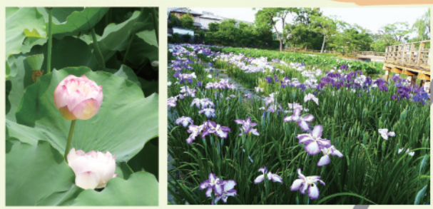
八条ヶ池の西湖紅蓮と花しょうぶ