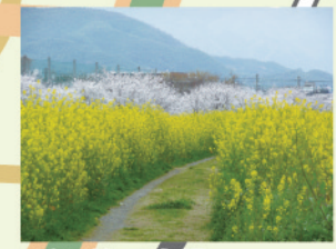
長岡第三中横 桜とセイヨウカラシナ