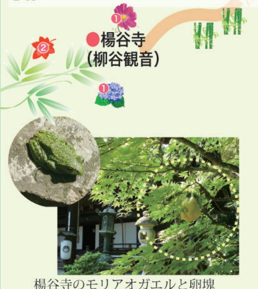
楊谷寺のモリアオガエルと卵塊