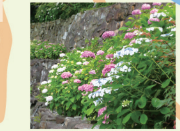
楊谷寺のあじさい