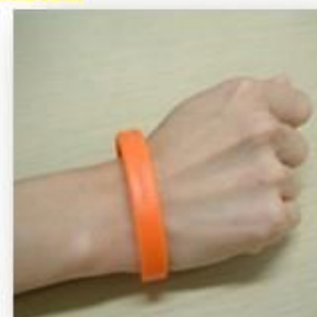
講座を受講するともらえるオレンジリング

定期的に認知症サポーターの養成講座を受講し、正しい認知症の知識を身に付けています。ご利用者様とご家族様に安心して配達をお願いできる事業所を目指しています。