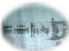
昭和6年 新設の神足駅舎

ケーキは小麦粉不使用で主材料はおから、あとはバター、卵、砂糖、ベーキングパウダーです。小麦粉アレルギーの方にも安心、またおからは繊維質が多く含まれているので体内の掃除もしてくれるほか、たくさん食べなくても満腹感が得られるとの説明もあり、特に女性の受講者には大好評。「またこんなクッキングの講座を開催してほしい」とのリクエストもいただきました。