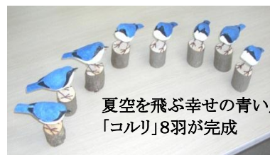
夏空を飛ぶ幸せの青い鳥「コルリ」8羽が完成

※コルリ：全長約13cm・体重約16g本州以北の山地に生息する夏鳥。林の中の深い藪に棲みあまり姿をみせない。オスはるり色、顔は黒くの下は真っ白。メスは青っぽい腰と尾が特徴