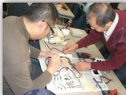
※写真は当室主催「わくわく講座」より

【講師のコメント】 社会経験の豊かな大人が子ども達を喜ばせようと、その子なりの大事なおもちゃ、傷んでしまったおもちゃ、あきらめかけている難儀な故障のおもちゃに立ち向かい、歯が立たない場合は仲間それぞれの得手や技術情報を共有し見事に復元する姿を目のあたりにした子ども達はなにを受け取るのでしょうか。そのことが私たちおもちゃドクターの励みなのです。