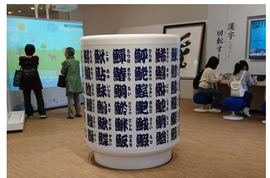
お寿司屋さんでお馴染み、魚偏の漢字がズラリと並んだ巨大湯呑で記念撮影も

自由に検定問題にチャレンジできるコーナーもありますので、検定を受ける前に気軽に実力を試すこともできます。ワークショップも開催されていますので、年齢を問わず楽しみながら学べる、まさに「生涯学習」の施設でした。夏休みのお出かけに是非どうぞ。（相談員 M・S）