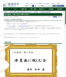
オンラインギャラリー

長岡京市のホームページ ( http://www.city.nagaokakyo.lg.jp/ ) からご覧頂けます。