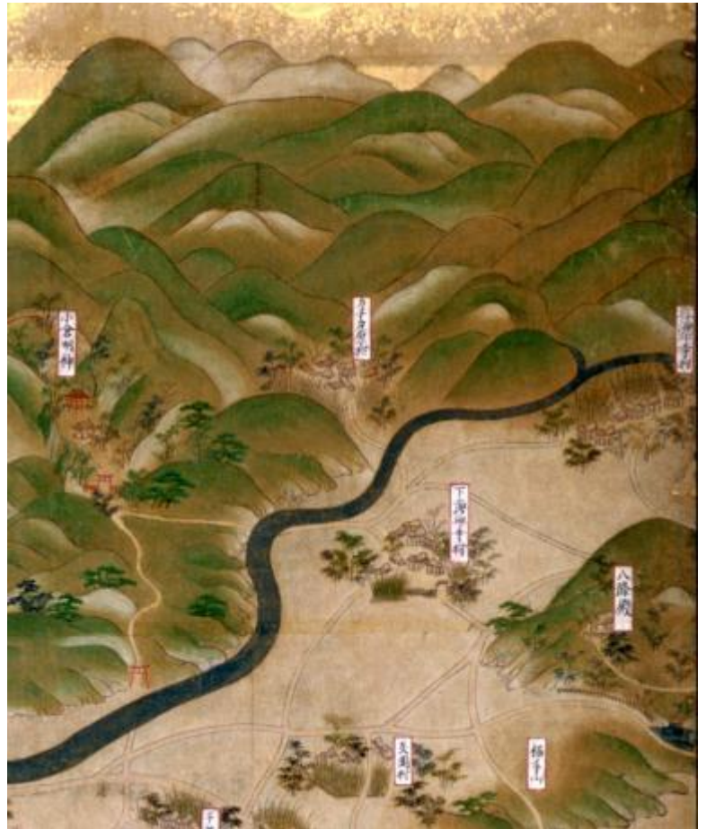
洛外図屏風（神戸市立博物館蔵）

下海印寺は明治前期で戸数35戸、人数95人。長岡京市内では比較的小規模な村ですが、西山のみどりと小泉川の清流のなかで、豊かなくらしが営まれてきました。