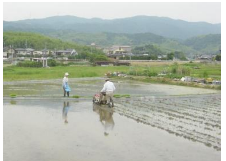
下海印寺の田園風景（平成21年）