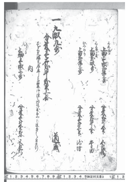
延宝7年（1679）神足村検地帳（部分） 教育委員会所蔵 道成の項目に面積・年貢高に並んで、「是八文禄元辰年高麗御陣之時道二成、於尔今道有之二付、如斯」との注記が見える。

延宝年間（1673-80）の検地帳には、文禄・慶長の役の際に道として築造、今に至っていると記載されています。また、江戸後期以前の年紀を有する絵図類で、西国街道を専ら「唐海道」と注記していることから、その契機は豊臣秀吉による朝鮮出兵のための軍勢や物資の輸送であったようです。