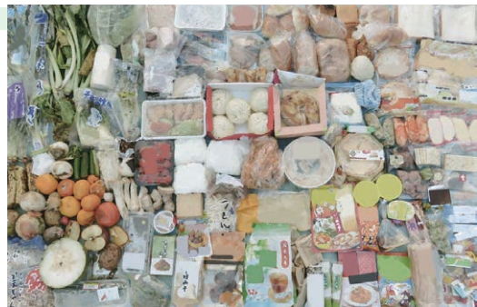
捨てられた手付かずの食品例

食品ロスの中には、手付かずの状態ですべて捨てられている食品もあり、この状況を多くの方に知っていただくことが大切です。