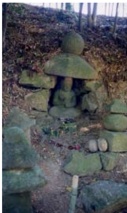
恥じらうような表情の石像 大日如来坐像

律儀に働きつづけてきたあるお父さんが、昨年5月に退職して背の荷を下ろしました。7月の朝、自宅前を掃除していてにわかには倒れました。心臓の病苦でした。臥床で生死をさまよいます。1カ月後に無事、退院し