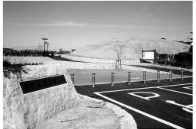
4月1日にオープンした今里大塚古墳公園