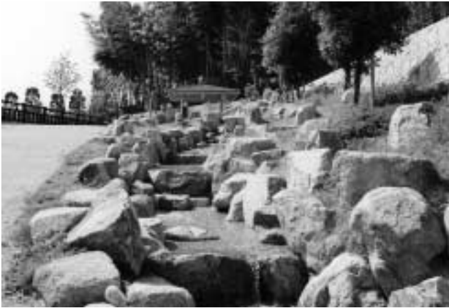
5月1日にオープンした西山公園