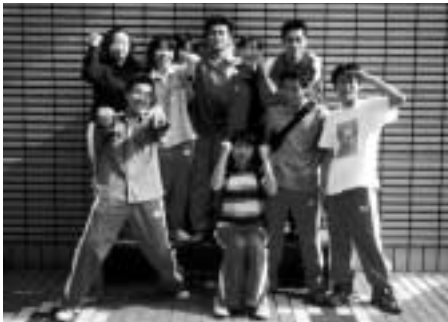
長岡京市子供会指導者連絡協議会 (通称「どんぐり会」)

わたしたち「どんぐり会」のメンバーのほとんども、この研修会の参加者でした。当時、お兄さん・お姉さんたちからゲームや仲間づくりについて教えてもらい、そのことが楽しかったから、今またこのように子どもたちと接しています。