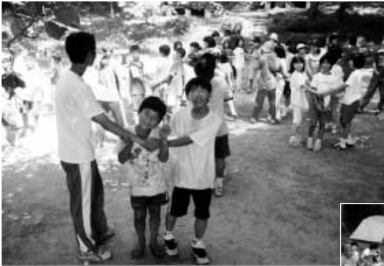
木立ちの下で楽しいゲーム