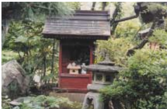
木立が影を落とす池の島に立つ竜神さん祠

静寂です。木立の緑が、夏の日にきらきらと揺れ光っています。風が樹間を走ると、みどり葉が匂いたつようです。