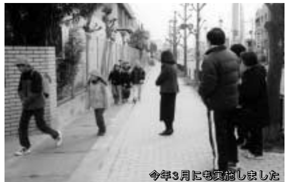
今年3月にも実施しました

6月16日(土) 午前7時45分～8時40分ごろ 通学路などで子どもたちに声かけを!