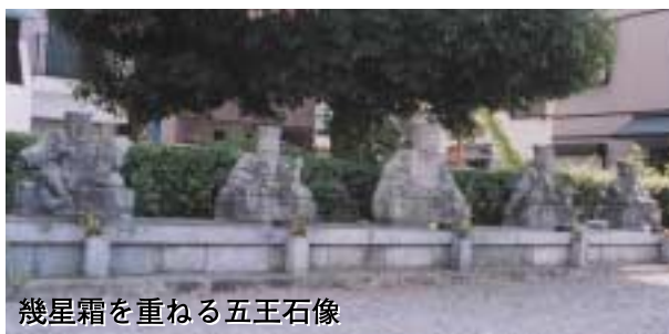
幾星霜を重ねる五王石像

善悪の業によって死後に住む六つの迷界を六道とといいます。六地藏とは、その六道それぞれで苦しみを救って教え導いてくれる地藏のことです。市教育委員会の調べでは、石仏群はすべて江戸末期で、花崗岩製です。丸彫りの坐像です。