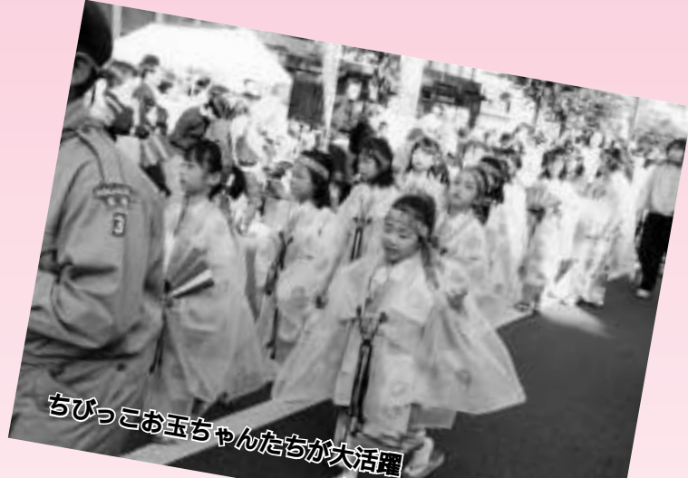
ちびっこお玉ちゃんたちが大活躍