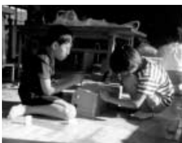
もうすぐ完成マガジンラック

今回のマガジンラックは、のこぎりで切る作業が多く、腕が痛くなる人や難しいと言っている人がいました。みんなは、釘をさしたむところが一番面白かったようです。完成した人は、難しかったけど最後までできて良かったと、につこりした表情で言っていました。