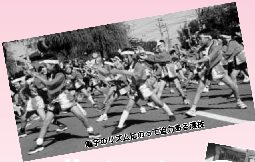
囃子のリズムにのって迫力ある演技

さわやかな秋、風もなく抜けるような青空です。10回目の「長岡京ガラシヤ祭 2001」は、絶好の祭り晴れになりました。お玉さん、ガラシヤカップル、ちびっこお玉ちゃんたち。時代衣装を身に付けた歴史絵巻、沿道を沸かせる祝い町衆、行列に参加した多くの人たちが市中を巡ります。イベント会場はどこもみな笑顔であふれていました。