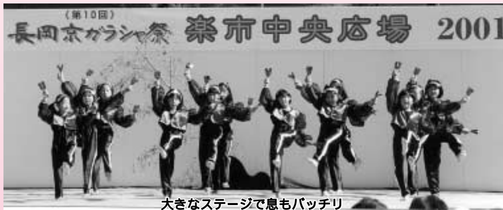
大きなステージで息もバッチリ