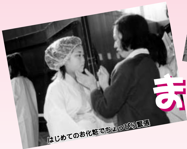
はじめてのお化粧でちょっぴり緊張