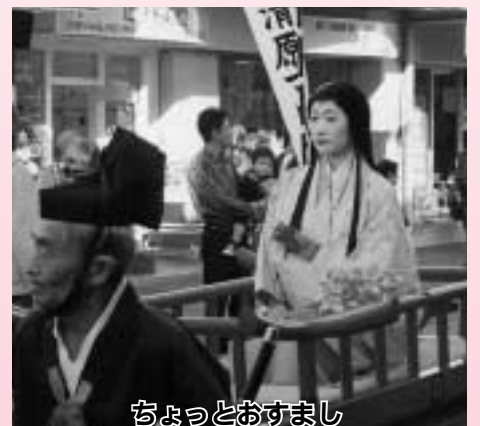
ちよっとおすまし