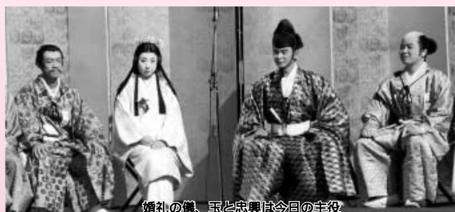
婚礼の儀、玉と忠興は今日の主役