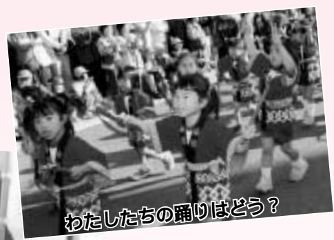
わたしたちの踊りはどう?