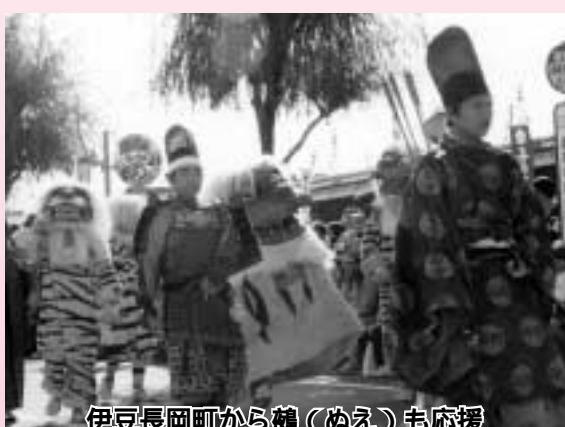
伊豆長岡町から鶴(ぬえ)も応援