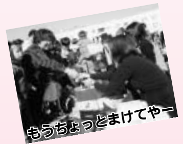
もうちょっとまけてやー