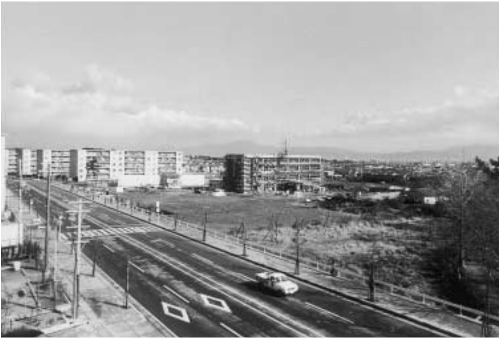
昭和47(1972)年、現乙訓消防組合本部から見た長六小(中央)。文化センター通りの並木は巨樹になった。

優しい稜線の比叡山だけが、今も変わらぬ姿です。市は、昭和42〜50年だけで6つの小学校新設に追われました。写真は、48年開校の長六小の建設風景です。42年に滋賀県に移ったタキイ種苗長岡研究農場の跡地です。道の両側の団地も、農場跡に44年に建った天神ハイツです。群青の空に、秋にしか見られないちぎれ雲が。