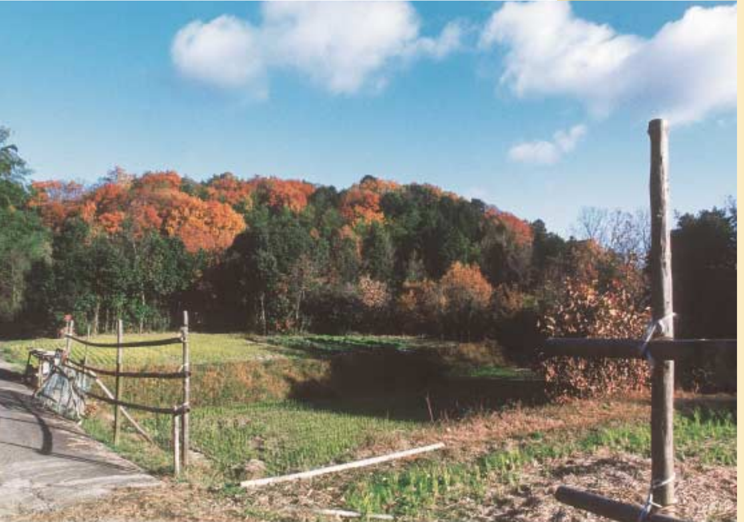
粟生清水谷で