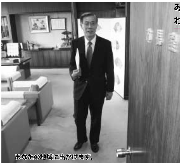
あなたの地域に出かけます。