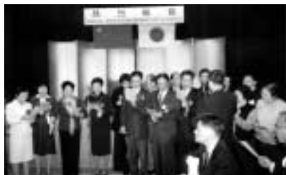
日本語と中国語で「北国の春」を合唱(中央公民館市民ホール)