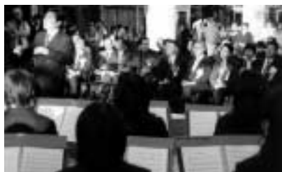
長岡第二中学校の生徒が吹奏楽で歓迎(市民ひろば=図書館側)