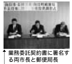
↑業務委託契約書に署名する両市長と郵便局長

外務職員が郵便物の配達中に廃棄物の不法投棄を発見した場合、長岡京市と向日市に情報提供する業務が、11月1日(土)から始まり