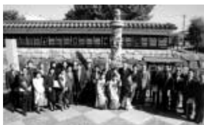
寧波市から贈られた雲龍石柱の前で記念撮影(勝竜寺城公園)