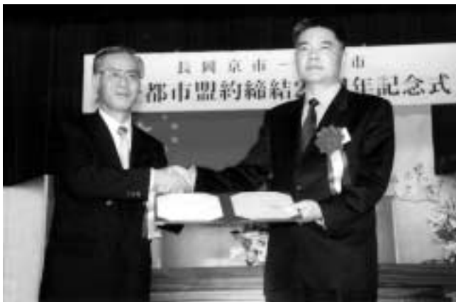
友好交流の発展を誓い合う小田豊 長岡京市長(左)と金徳水寧波市長(右) (中央公民館市民ホール)

長岡京市と中国・寧波市は、昭和58年4月に友好都市盟約を結び、経済や文化など幅広い面で交流を続けてきました。今年で20周年になります。10月29日(水)、金徳水寧波市長を団長とする政府代表団9人と友好代表団17人が本市を訪れ、勝竜寺城公園など市内を見学した後、中央公民館市民ホールで開催した友好都市盟約締結20周年記念式典と歓迎祝賀会に出席しました。両市の関係者や市民、代表団が交流を深めるとともに、協力関係の一層の発展を誓い合いました。