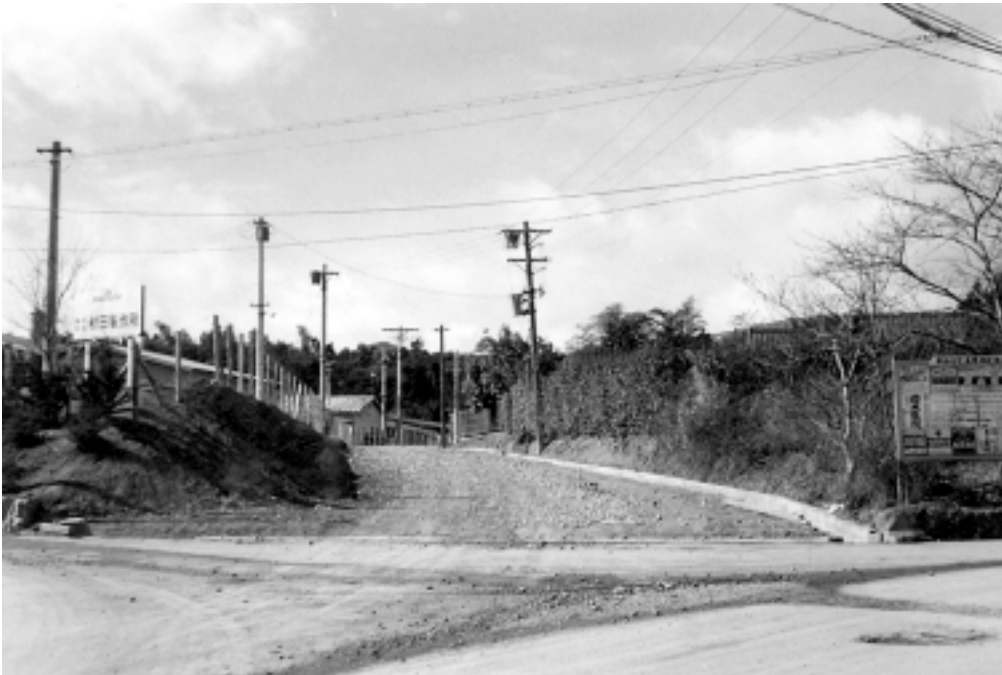
昭和37 1962 年撮影。現在の天神二・三・四丁目の境界にあたる場所です。この年、奥海印寺方面へと西に向かって伸びる道が拡幅されました。