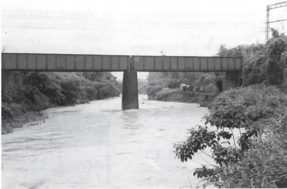
▲昭和36(1961)年に撮影。小畑川はかつて、増水でたびたび堤防が決壊する「暴れ川」でした。その後、護岸工事や親水空間づくりなどの整備が行われ、現在は水辺の憩いの場となっています。