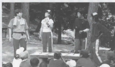
▲一緒に楽しもうね

どんぐり会のメンバーの多くは、子供会リーダー研修会の参加者です。わたしたちも、キャンプや料理体験など、たくさん仲間と楽しんだことを覚えています。自分も子どもたちと楽しみたい、子どもたちにも楽しんでもらいたいと、活動を続けています。今は、リーダー研修会や地域の子供会などの活動をサポートをしています。