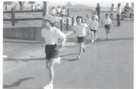
▲ゴールはすぐそこ、ラストスパート

◇そして本番、マラソン大会 11月17日金曜日、ついにマラソン大会の日がやってきました。たくさんさんの声援の中、一番はじめに1年生が走り出しました。初めての