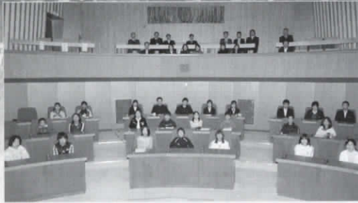
市内小・中学校の代表者たちが開いた「長岡京市子どもサミット」（本紙編集日程との関係から、写真はリハーサル時のものを掲載しています。）

昨年12月22日、市内の小・中学校の児童・生徒の代表28人が集まり、市議会議場で「長岡京市子どもサミット」を開きました。いじめなどの人権上の問題を自分自身の身近なものとしてとらえると同時に、地域社会の一員であることの自覚を持つようとするためです。