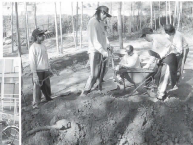
働くことの大変さを実感

最後にこの体験は、わたしたちにとって本当に良い経験になり、心に残るものとなりました。この経験を決して無駄にせず、自分た