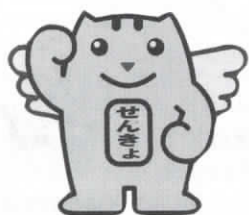
明るい選挙のイメージキャラクター 「めいすいくん」