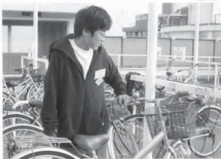
ちのこれからの生活に生かしていきたいと思っています。