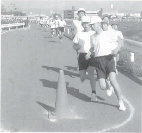
▶折り返し地点で一気に引き離そう

分間、「全校マラソン月間」として練習に取り組みました。高学年は200メートルの大きなトラック、低学年は150メートルの少し小さめのトラックを走りました。はじめは、ペースがわからずに、5分間を走り続けることができない人が多かったですが、だんだん5分間をしっかりと走りきれる人が増えてきました。練習することで、走りきる体力と自信がついてきて、マラソン大会が待ち遠しくなってきました。