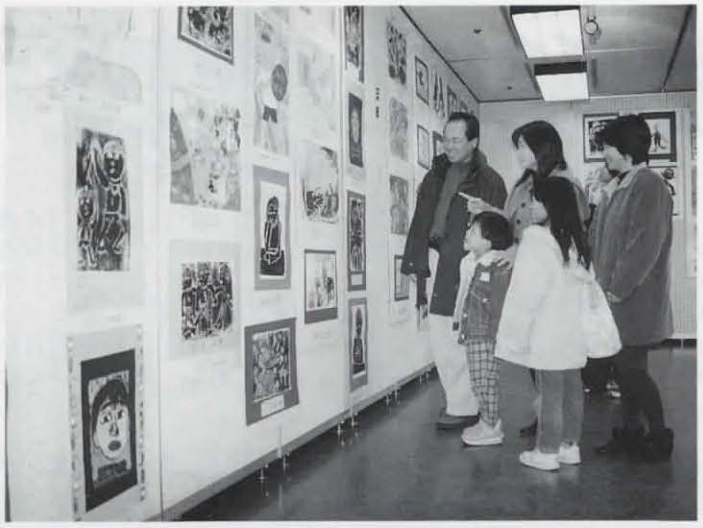
第15回長岡京市小中学校美術展 (2月19日・20日、中央公民館)

市内の小中学生と姉妹都市・伊豆長岡町の小中学生が授業の中で取り組んだ絵画、版画、工作品などの作品306点は、どれも豊かな感性があらわれるものばかり。訪れた人たちは、熱心に見入っていました。