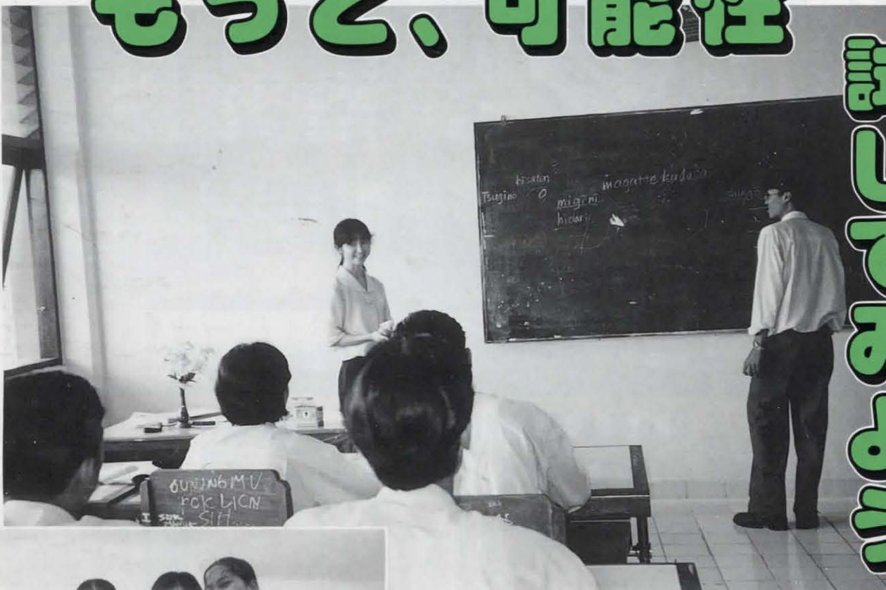
⑤日本語授業。「ツギノコウサテンヲ」(黒板に注目！)

国際協力事業団(JICA)が実施する事業。昭和40年の発足以来、アジア・中南米・大洋州・中近東・東欧の国々へ2万人を超える隊員を派遣している。年齢資格は20～39歳の人。活動分野は農林水産、加工、保守操作、土木建築、保健衛生、教育文化、スポーツなど。任期は2年間。募集は、春(4月10日～5月20日)と秋(10月中旬～11月中旬)の年2回 【問い合わせ】大阪国際センター(☎0726-41-6900)または京都府府民労働部青少年課育成係(☎414-4306)へ。 インターネットのホームページは、 http://www.jica.go.jp/Index-j.html 募集要項は、市青少年・スポーツ課にもあります。