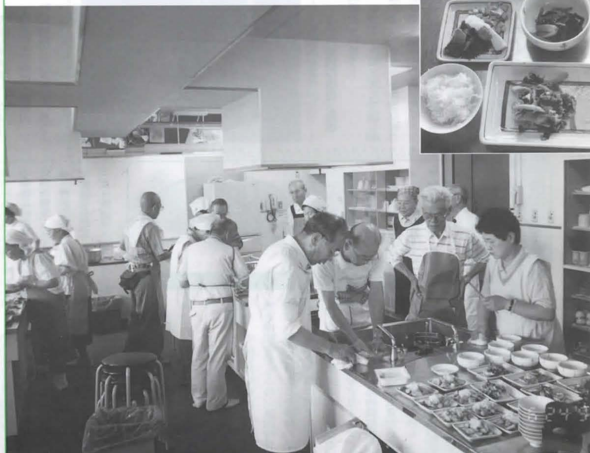
▲高齢者を対象とした老人クラブの料理教室(6月24日 保健センター)