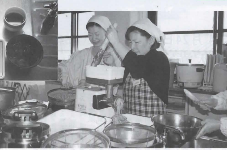
▲人気の減塩みそ作り(2月12日 保健センター)

現代は、飽食の時代といわれていますが運動や栄養バランスの偏りが原因で、生活習慣病などの病気になる人が年々増えてきています。そこで、市や保健所の指導のもとに、食生活を通して健康づくりに取り組んでいる長岡京市食生活改善推進員協議会(ボランティア団体)に注目してみました。「正しい食生活」について、あなたも一度見直してみてもいいかもしれません。