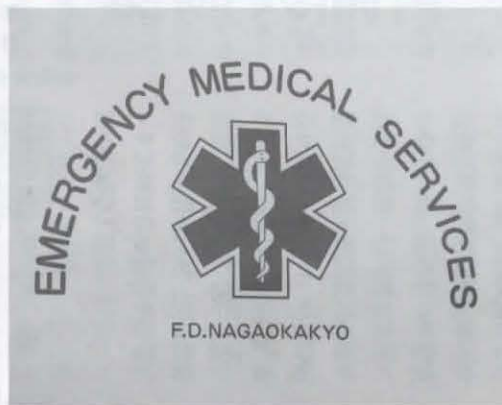
▲シンボルマークの「生命の星」