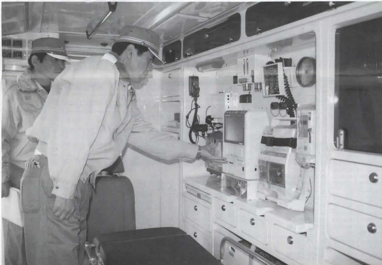
▶高度救命処置用資機材が搭載されている内部

現在、市消防本部には五人の救急救命士が在職しています。従来の救急隊員は、人工呼吸や包帯による止血などの救急処置しか認められていませんでした。4年から救急救命士が新たな国家資格として認められ、特定の医療行為ができるようになりました。市でも、4年11月に救急救命士の国家資格試験に一人が合格して、6年1月から高規格救急車の運用を開始しました。今回配備された高規格救急車は、従来のものと比べ車内(幅高さ)に余裕があり、救急救命士が高度救命処置用資機材を効率良く操作できるように