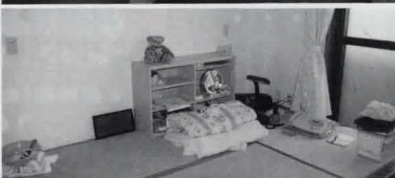
▲入居者にあった部屋の作りになっています

イレの便器の高さを合わせたり、座位を安定させる金具を付けたりと、きめ細やかな配慮がされており、どの部屋も窓が大きく明るくなっているところでは、現在、入居している人は乙訓の里に通所する二十代後半から四十代の七人(男性三人、女性四人)です。朝・夕の食事、入浴の時間帯には、NPO「乙訓介護サービス」のヘルパーが八人前後で介助しています。夜間も男女各一人のヘルパーが常駐しています。 「竹とんぼ」の名称は、入居者を含む乙訓の里の仲間たちが「竹とんぼのように自由に飛んでいけたら」という願いを込めてつけられました。 竹とんぼでの生活は、毎朝7時30分ごろの朝食から始まります。起床時間は入居者が朝食に間に合うように自分で決めます。8時45分になれば迎えるバスに乗り込み「乙訓の里」(勝竜寺長愚)へ作業に向かいます。 午後3時30分に各作業を終えた入居者は、竹とんぼへと