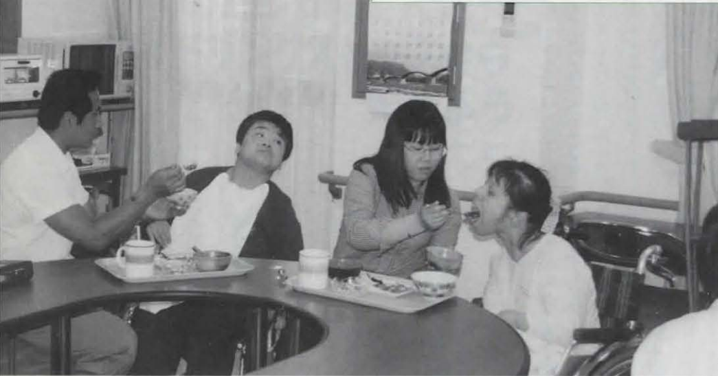
▲話もはずむ食事の時間