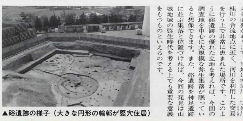
▲碯遺跡の様子(大きな円形の輪郭が堅穴住居)