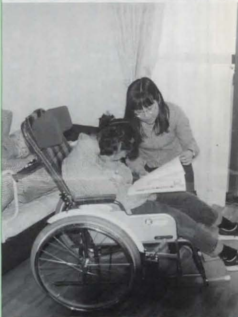
▲部屋では思い思いの時間を過ごします