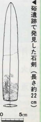
碯遺跡で発見した石剣(長さ約22cm)

市内には、雲宮遺跡、神足遺跡など全国的にも有名な弥生時代の集落が存在します。ここで紹介する碯遺跡も弥生時代の集落ですが、これまで堅穴住居など集落の様子を具体的に示す遺構は発見されていませんでした。今回、サントリー(株)桂ビル工場の敷地内で実施した調査では、弥生時代の堅穴住居十三棟をはじめ、土坑十四基、溝四基、柱穴多数、沼などを発見し、碯遺跡に大きな集落があったことを確かめました。 弥生時代の出土遺物では、完全な形の鉄剣形石剣など石製品の豊かさが目立ちました。また、石剣の未製品や剥片、砥石などが出土したことから、碯遺跡が石製品を制作する集落であることも明らかとなりました。 碯遺跡で大きな弥生集落を確認したことが、どのような意味を持つのでしょうか。それには、乙訓地域の南玄関とも言える遺跡の立地を考える必要があります。当地は木津川、宇治川、桂川の合流地点に近く、河川を利用した交易を行う上で非常に恵まれた場所です。このように碯遺跡の優れた立地を考えると、今回の調査地を中心に大規模な弥生集落が眠っていると想像できます。また、碯遺跡を神足遺跡に並ぶ集落と位置づければ、今回の発見は山城地域の弥生時代を考える上で重要な意義をもつものといえるのです。