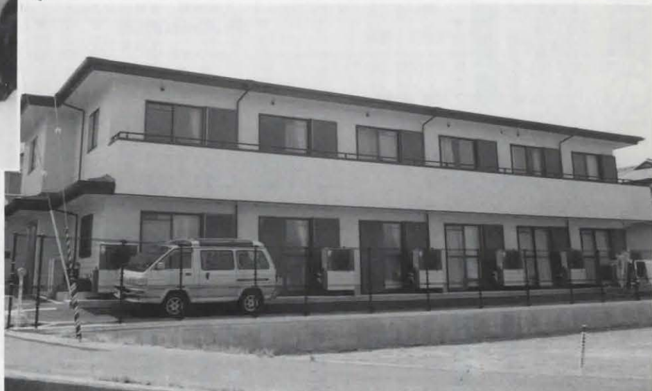
▲身体障害者福祉ホーム「ハイツ竹とんぼ」