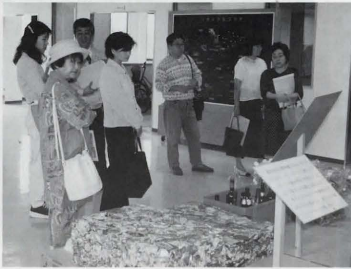
第二回市政モニター公共施設見学会で、乙訓浄水場(仮称)とクリーンプラザおとくにを見学しました。身近な水とゴミのこととあって、熱心な質問が多く飛び交いました。(クリーンプラザおとくに 5月26日)