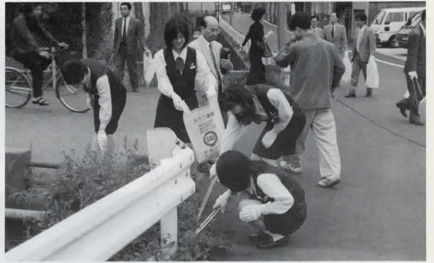
ごみゼロ運動の活動の一環として、市役所付近一帯のごみを拾い集めました。(5月28日)