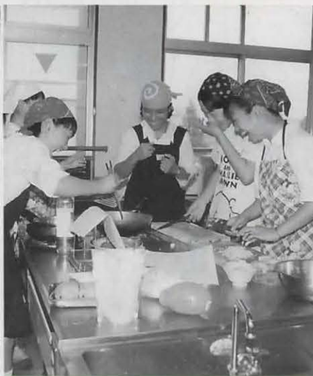
選択授業でグアム料理の実習 (6月24日 長三中)