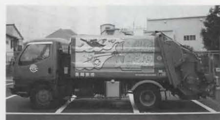
昨年応募された中の採用作品の一例

夏休み 子ども 教室 陶芸 ▼とき：7月28日(水)、30 日(金)、8月11日(水)、午後 1時30分～3時30分、8月25 日(水)、午前10時～正午 ▼対象：市内の小学4～6年生(今 までに受講した人は除く) ▼定員：二十四人(先着順)。 申込みは一人一名分に限りま す ▼内容：作陶から完成ま での実技指導 ▼材料費：一 人三百円 ※申込みは、7月15日(木) 午前9時から材料費を持って 中央公民館(☎951-1278)へ。