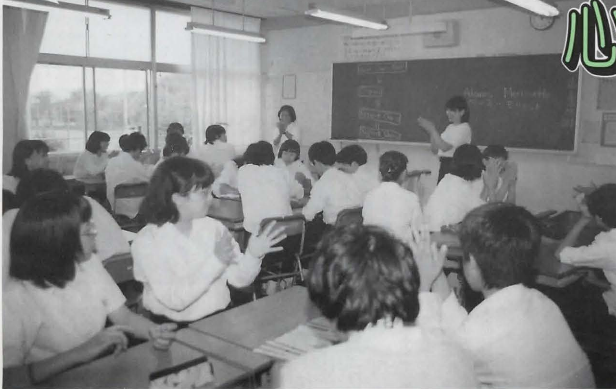
▶シャーリーの楽しい英語の授業 (6月24日長岡第三中学校3年5組)