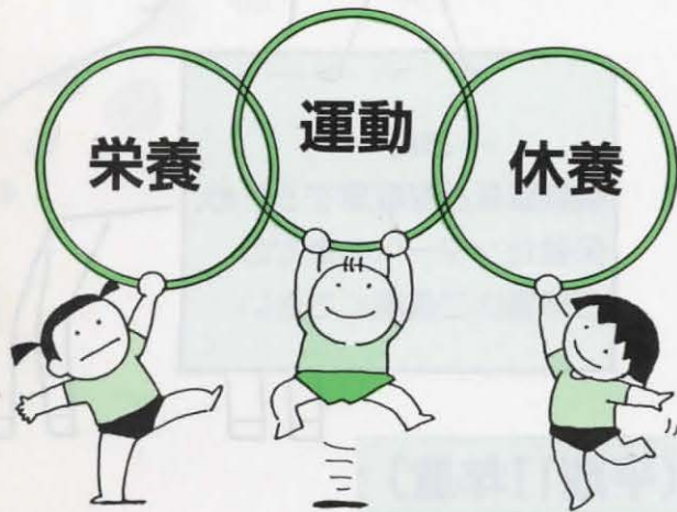
健康づくりの3本柱

10年度の基本健康診査の結果では、指導や治療の必要な人を合わせると、高脂血症は総受診者の40%、高血圧症は36%になります。