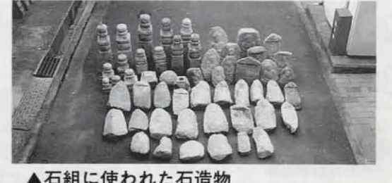
▲石組に使われた石造物