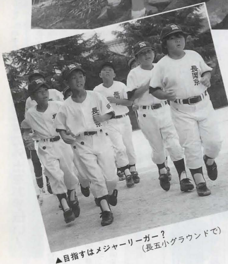
▲目指すはメジャーリーガー?(長五小グラウンドで)