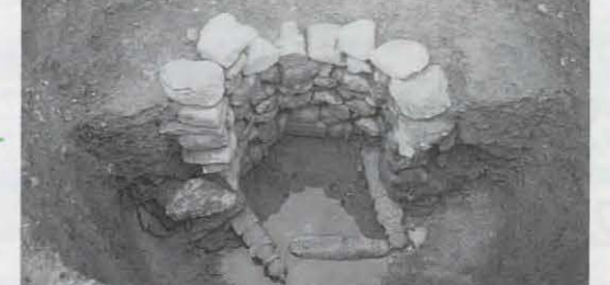
▲石組を半分に割った状況