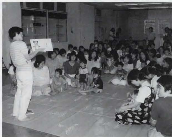
▲「親子で遊ぼう」の楽しい絵本の読み聞かせ