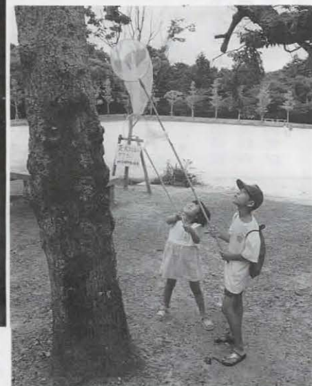
◀セミをゲット!(長岡公園で)