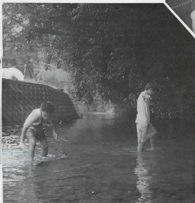
▲自然は友だち(小泉川西代橋付近で)