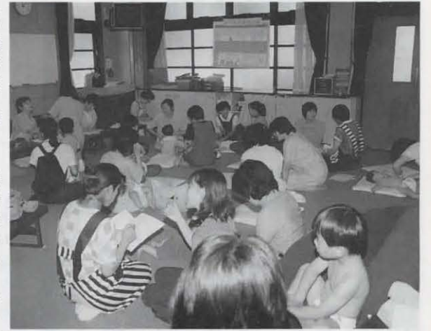
▲何でも気軽に相談できます

「親と子の健康相談」ってご存じですか。毎月四回午前9時30分～11時に市健康推進課母子保健係が実施している妊産婦と乳幼児のための健康相談です。場所は、保健センター、中央公民館、京都中央農協海印寺支店、きりしま苑で行っています。保健婦や栄養士などが就学前の子どもの発育、育児などについて気軽に相談に応じています。希望があれば、身長・体重などの計測もします。