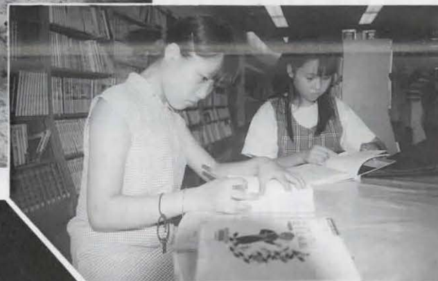
▲研究の成果は?(図書館で)