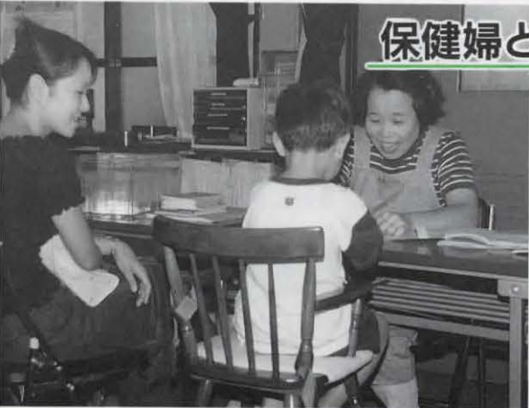
外へ親子で遊びに行きこもらないで親子で外へ

子育ては夫婦で協力し合うものと、お互い支え合い、熱心に真面目に子育てしている人が増えています。一方、「育児