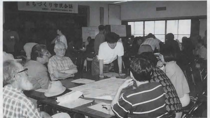
▲活発な意見が交わされた第1回まちづくり市民会議(6月)

これからのまちづくりの基本方針となる第3次総合計画の基本構想素案がまとまりました。これは、市民公募委員9人を含む長岡京市総合計画審議会や3,000人の市民アンケート、まちメール、団体ヒアリング、まちづくり市民会議などの論議を経てまとめられたものです。今後、この素案をもとに、具体的な計画を策定していきます。