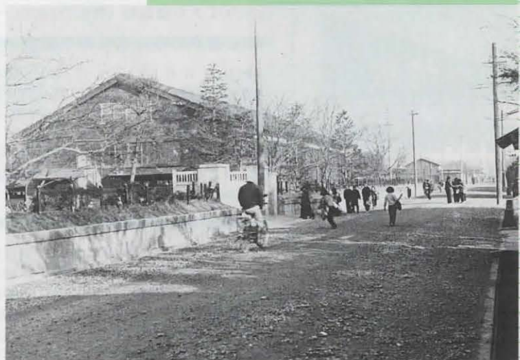
▲神足小学校 新西国街道から撮影。現在の体育館の場所に木造校舎が建っていた(昭和29年2月)