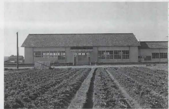
▲開田保育所 手前の畑は現在の市役所の場所(昭和27年3月)