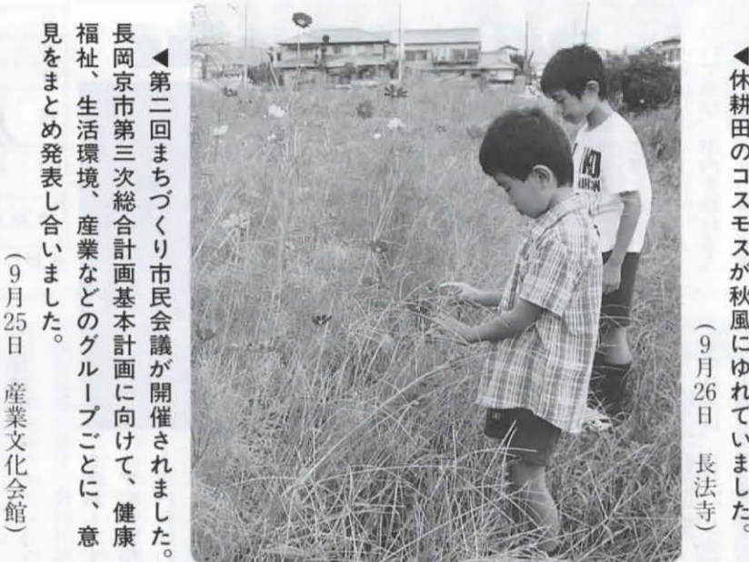
◀休耕田のコスモスが秋風にゆれていました。 (9月26日 長法寺)