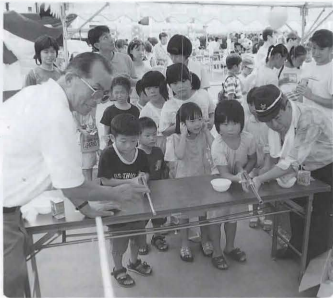
▶交通安全フェアが行われました。射的、スライボールすくい、ふあふあドームなどの楽しい催しに大勢の人が集まりました。 (9月23日 長岡自動車教習所)