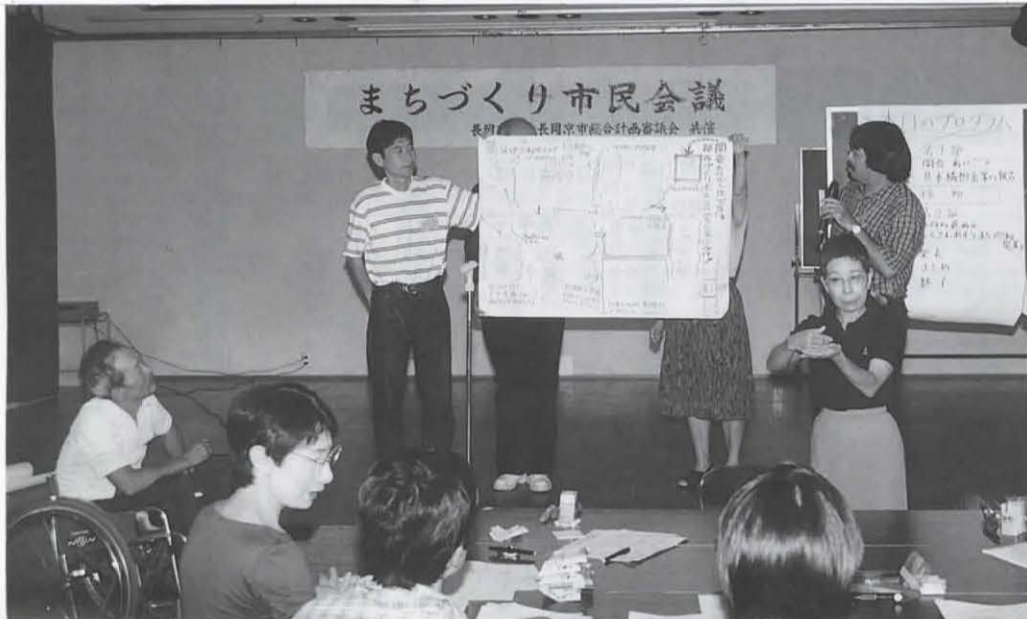
◀第二回まちづくり市民会議が開催されました。長岡京市第三次総合計画基本計画に向けて、健康福祉、生活環境、産業などのグループごとに、意見をまとめ発表し合いました。 (9月25日 産業文化会館)

みんな集まって楽しく学習しませんか 学校特別教室など 開放します 11月分申請受付 市内で活動する団体やサークルに小学校の音楽室などの特別教室や会議室を開放して