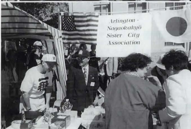
⊕ 踊りの輪・友好の輪 ⊖ 大賑わいの長岡京市ブース (いずれもタウン祭会場で)

られ、大歓迎を受けました。タウンホール前の大通りは歩行者天国です。歴史委員会環境保護委員会など、さまざまな団体が出店しています。市民訪問団による長岡京市の姉妹都市ブースでも、日本のPRが行われました。特設ステージでは、市民によるバンド演奏やダンスが披露されています。ここでも、友好代表団が一人ずつ紹介されました。代表団は炭坑節を披露、取り囲んだアーリントンの人々から大きな喝さいを浴びました。