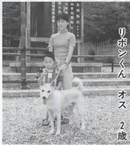
リボンくん オス 2歳

家族みんなが動物好きで、たまたま近所で子犬が生まれたのをもらったのが飼うきっかけ。しつけや散歩はもっぱら私の役目です。散歩には自転車で行くこともあり、30分くらいかけますね。人懐っこい性格なので周りの子どもなどに飛びかからないように気をつけています。犬を飼うことにより、子どもが生き物を大切にすることを学べてほしいと思います。