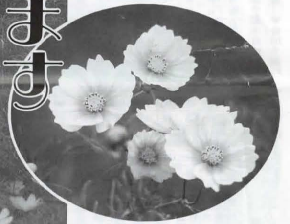
▶色とりどりに咲くコスモス(9月10日浄土谷柳谷)

秋風に誘われて散歩していると一面色とりどりの秋桜(コスモス)が、ゆらゆらと気持ちよさそうに揺れているのが目に入ってきます。このコスモス園は、農家のみなさんの協力で休耕田を利用して6年前から始まったものです。今では、秋の風物詩の一つとして市内に定着し、現在三十カ所あります。 今月は、コスモスに関連したイベントがあります。みなさんもぜひ参加してみたいかがでしょうか。