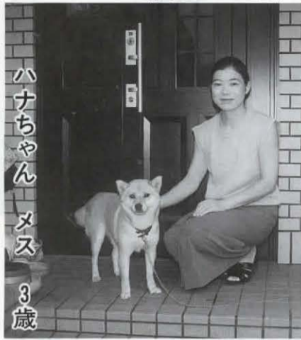
ハナちゃん メス 3歳

子どもから手が離れたのを機会に、近所で生まれたハナをもらいました。初めて犬を飼うので、病気などしないか不安でしたが元気に育っています。愛くるしい顔で、道行く人にも声を掛けられる人気者です。日中は外で飼っていますが、さみしがりやなので夜は家の中に入れてあげます。今では、家族の話題の中心はハナが独占。わたしたちには、欠かせない家族の一員です。