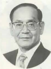
長岡京市長 今井 民雄

この行財政改革大綱は「リストラ元年」の宣言にはじまる本市の一連の行革行動の集大成とも呼ぶべきものです。「いのち輝く新長岡京時代の創世」実現のため、行政の政策能力を高め、新しい時代、地方分権の時代を先駆的に築いて