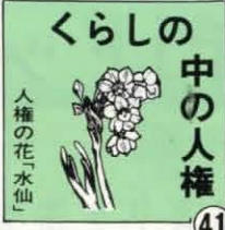
くらしの中の人権