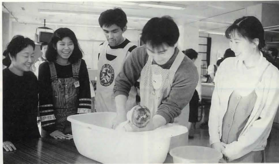
▲男性も女性も、職場や地域で生き生きと活躍できる社会のために(保健センター主催の両親教室で沐浴の方法を学ぶ未来のパパたち)

男女の権利が等しく尊重され、社会のあらゆる分野で、男女共に生き生きと活躍できる社会。そんな社会の実現をめざして、市では男女共同参画プラン(第一次長岡京市女性行動計画)を策定しました。男女の別なく、持っている能力を十分に発揮し、自分らしい生き方ができる社会を、みんなで築いていきましょう。