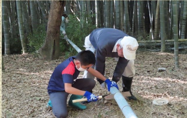
竹林再生のため、まず不要な竹を切っていました。