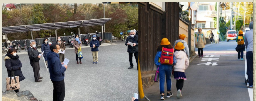
行方不明者役の打ち合わせ

2月1日「高齢者行方不明搜索訓練」を実施しました。行方不明者役は、コミュニティ協議会役員等に協力をお願いし、五小5年生が下校時に“搜索”を行いました。事前に伝えてある「性別・年齢・特徴」などをもとに、行方不明者らしい人を見かけた児童は、帰宅してから学校へ電話で場所や特徴などを報告してもらいました。子どもたちの小さな情報が大きな力になることを期待し、皆さんの協力で高齢者が安心して暮らせる地域をめざして行きたいと思います。