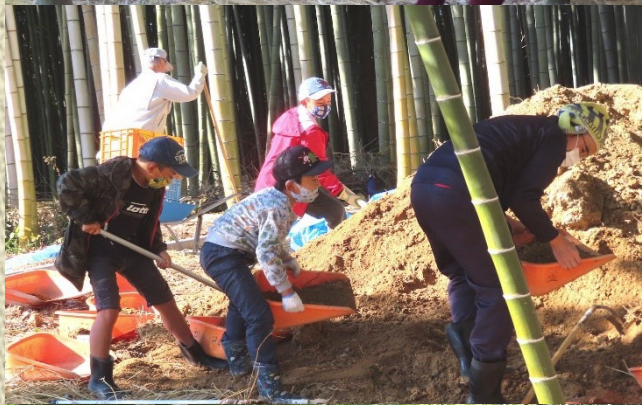
敷いた稲わらの上に、土を入れました。