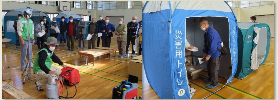
非常用発電機と投光器の操作訓練 要配慮者防災トイレの組立て

10月31日「長五小校区総合防災訓練」を、コロナ感染予防のため、コミュニティ協議会役員と各地区の自主防災会役員で実施しました。来年度はコロナ終息で各地区からの避難訓練・避難所運営訓練・炊き出し訓練などを行い、いざという時の「共助」を目指していきたいと思います。皆さまのご理解とご協力をよろしくお願い致します。