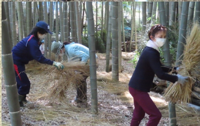
土の温度と湿度を保ち、土が硬くならないようにするため、刈取った稲わらをびっしりと敷きました。