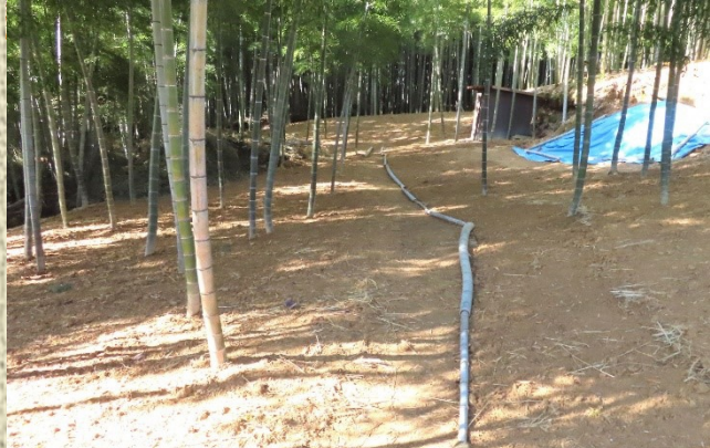
整備が終わり、春のタケノコ堀を楽しみに待ちます。左:江がねが丘竹林 右:河陽が丘竹林