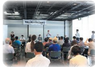
◀令和4年度 バンビオ1番館での開催の様子

今年も、開催時の新型コロナウイルス感染症の状況に応じた感染対策を行いながら開催します。 みなさんのご参加お待ちしております。