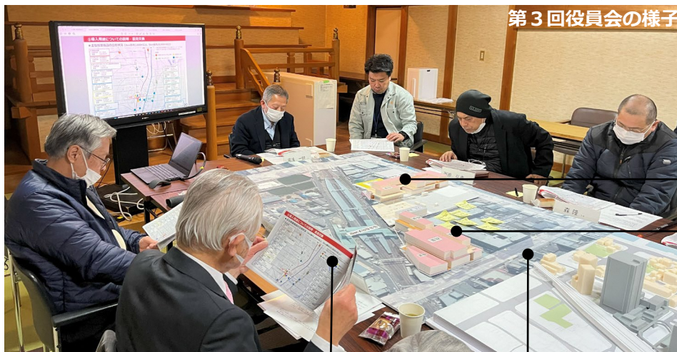
第3回役員会の様子

今回は「長岡天神らしさを活かした駅前空間」「周辺環境を踏まえた駅前に必要な施設」について、周辺の施設立地や規模など客観的なデータ等を踏まえ、下記のように意見交換をしました。