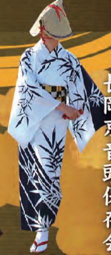
長岡京音頭保存会

各種観光情報の発信や新しい観光名所づくり、観光案内所の運営、箱掘り体験や特産物販売など、様々な観光振興活動を行っています。