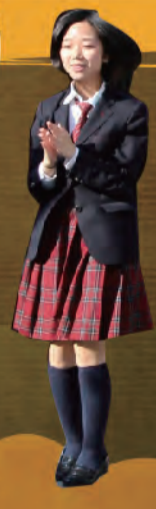
長岡京市 少年少女 合唱団

3年ぶりの長岡京カラシヤ祭を、中高生徒会を結集して、皆様と一緒に盛り上げたいと思います。