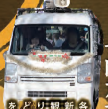
長岡京市観光協会

各種観光情報の発信や新しい観光名所づくり、観光案内所の運営、箱掘り体験や特産物販売など、様々な観光振興活動を行っています。