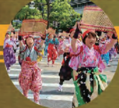
南京玉すだれ 結の会

小学生から大学生までの団員が、仲良く楽しく毎週日曜の午前中、中央公民館で練習しています。ボランティアや市内のイベントで歌っています。メンバー募集中心！歌の好きな子、集まれ！