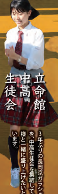
立命館 中高 生徒会

長岡京市のふるさと音頭である長岡京音頭の普及と継承を目的に昭和五十年に設立。より多くの市民の皆様が音頭を知っていただけるよう、積極的に市の行事に参加しています。