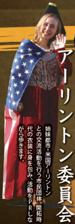
アールリントン委員会

勝龍寺城公園には孔雀がおりました。今は飼育小屋も取り壊されてありません。孔雀のことを忘れてないで欲しいと思ひ、ご婚札を孔雀の衣装で祝いに来ました。さあみなさん祝いをしましょう。