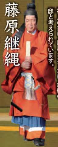
藤原継繩 百済王明信

右大臣。扶桑略記によれば、長岡の神足の家で維摩会を修したとされています。この神足の家は、藤原是公または、継繩の邸と考えられています。