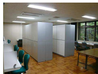
オフィス内の様子