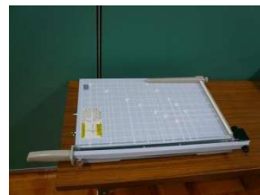
備品の一例(裁断機)