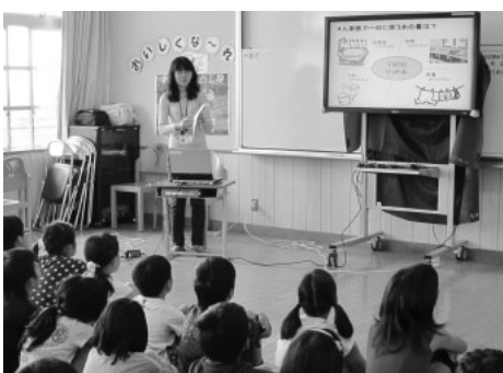
【写真】①水に関するクイズに答える子どもたち②下水道の話熱心に聞く様子(6月5日・長十小で)