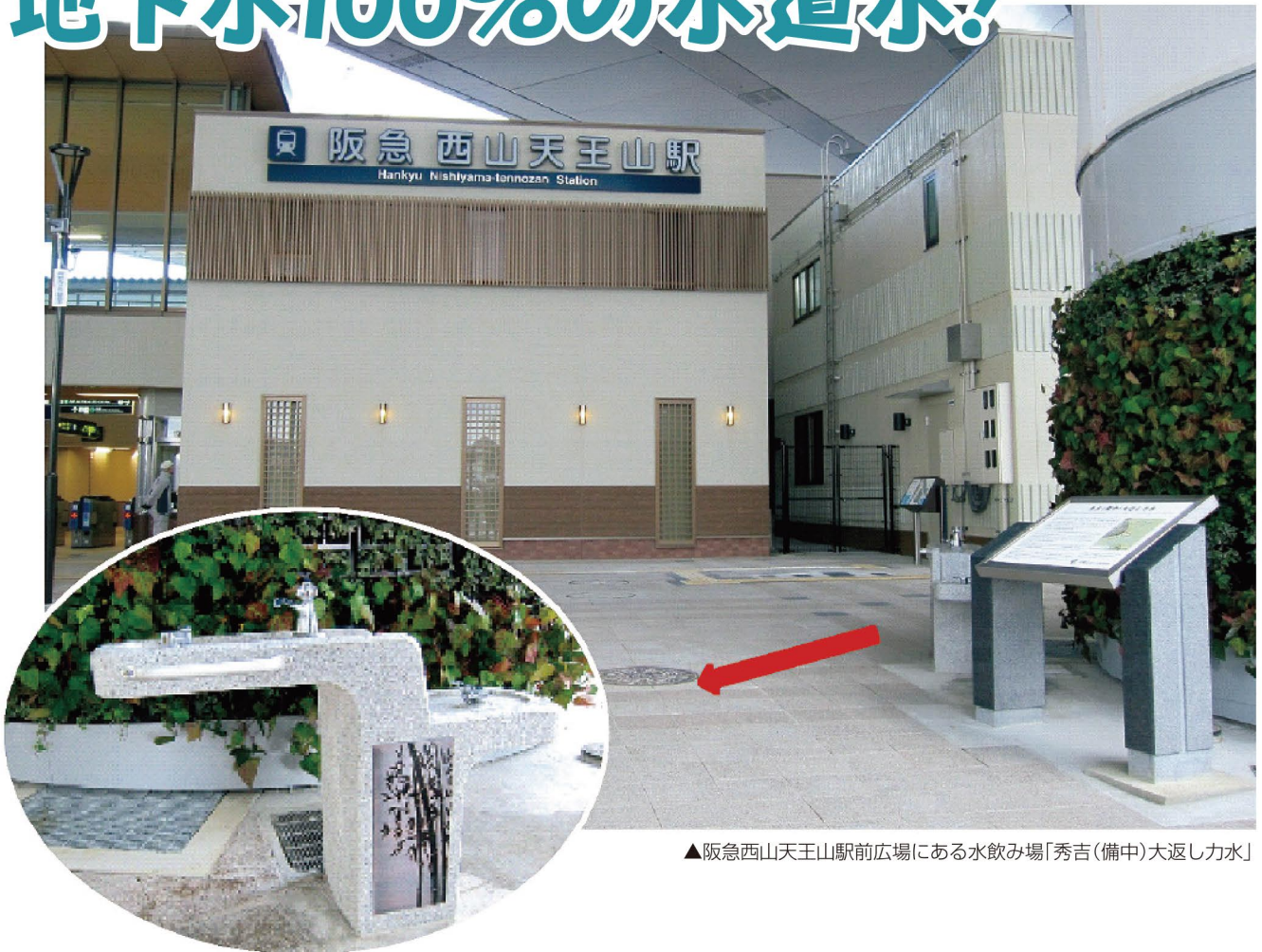
▲阪急西山天王山駅前広場にある水飲み場「秀吉(備中)大返し力水」

平成25年12月21日に給水開始50周年と阪急西山天王山駅開業を記念して、駅前広場に地下水100%の水道水供給施設「秀吉(備中)大返し力水」が完成しました。施設名は、本能寺の変を知った羽柴(豊臣)秀吉が、備中高松城(岡山県北区)からこの地までの約200kmを10日で踏破し、明智光秀を打ち破ったことに由来しています。