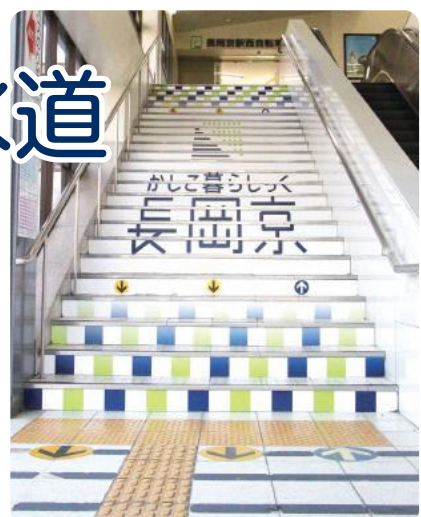
JR 長岡京駅西階段に設置されているロゴマーク