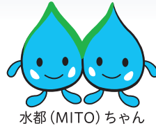
水都 (MITO) ちゃん