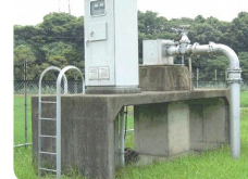
地下水を汲み上げる井戸