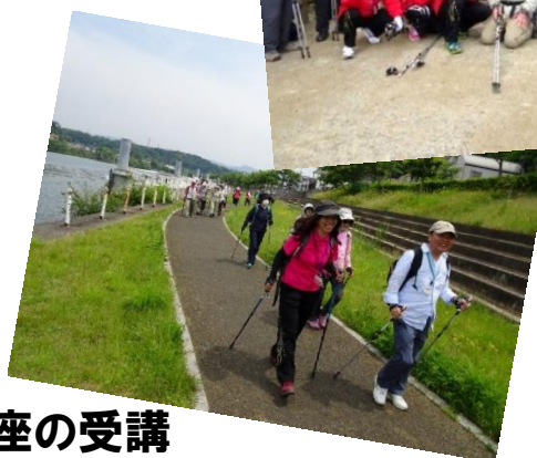
ポールハイキング enjoy フェスタ