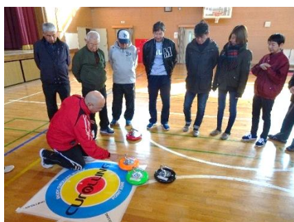
巡回教室の様子(カローリング)