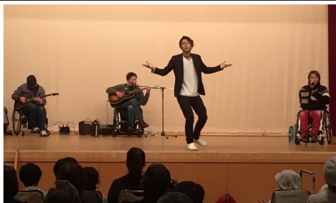
4 Disabilities による歌詞を手話パフォーマンスで表現した目でも聞ける音楽（3階 市民ホール）