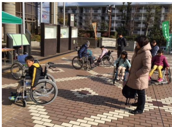
車いす体験（南側 市民ひろば）