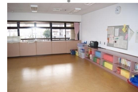
児童室 (51.0㎡ 託児用施設)