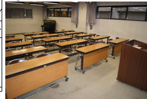
視聴覚室 (87.0㎡ 定員30人)