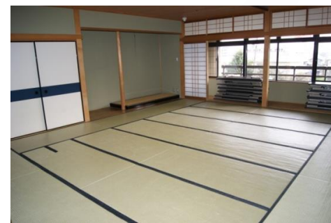
和室 (69.3㎡ 定員30人)