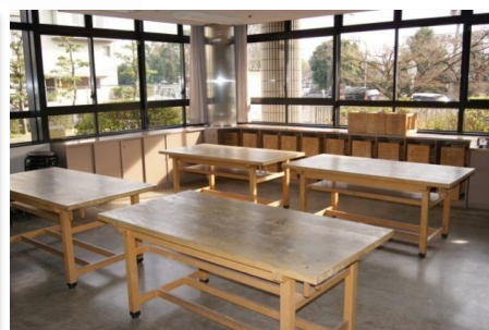
実習室 (54.3㎡ 定員28人)