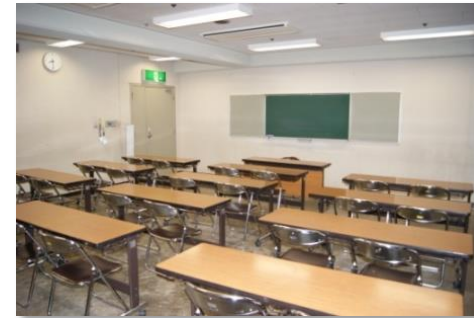
学習室1 (50.7㎡ 定員24人)