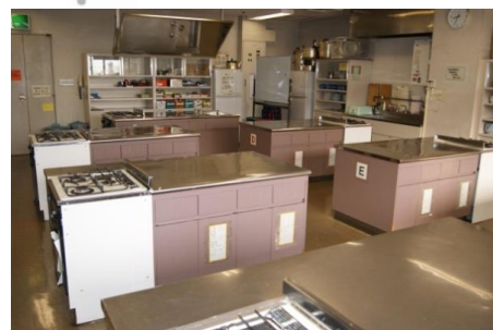
料理室 (72.3㎡ 定員36人)