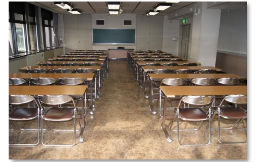
講座室 (101.7㎡ 定員70人)