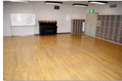
レクリエーション室 (104.0㎡ 定員40人)