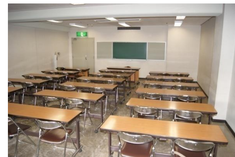
学習室2 (71.3㎡ 定員36人)