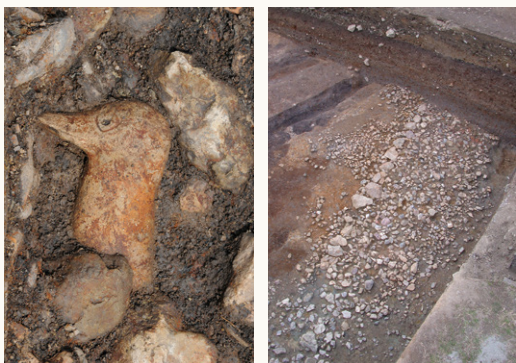
水鳥形埴輪 東造り出しの石敷