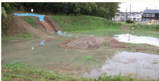
発掘調査中には西側周壕が台風の大雨で浸水することもあった