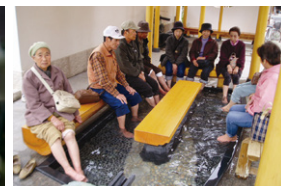
①金属を溶かし大砲を鑄造していた葦山反射炉。ユネスコに推薦書を提出し、早ければ来年、世界遺産に登録される ②特産のべにっぺ ③温泉地にある足湯は大人気

DATA ▷人口4万9,269人(H22国勢調査) ▷面積94.71km 2 ▷長岡京市と姉妹都市交流をしていた旧伊豆長岡町と、隣接する旧葦山町、旧大仁町が合併して平成17年4月に誕生。来年4月で市制施行10周年を迎える