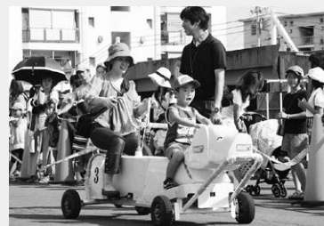
おもしろ自転車もあるよ

▶内容＝ミニSL乗車、おもしろ自転車、ミニコンサート、京都府警察平安騎馬隊による体験騎乗(先着で50人)、はたらく車の展示、交通安全の絵やポスター・干支スタンプの展示と表彰、読み聞かせと工作のコーナーなど ▶申込不要