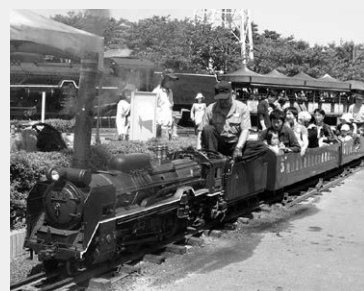
大迫力のミニSLに乗ろう！