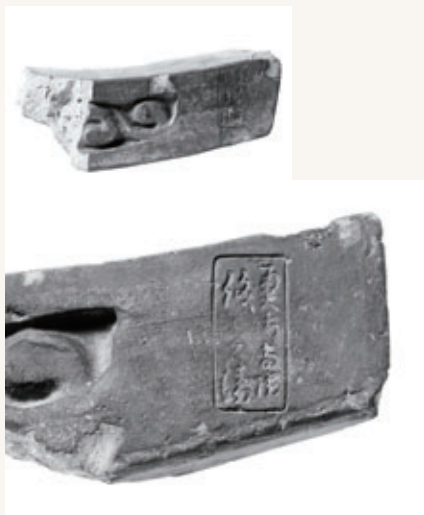
乙訓寺と、その周辺から見つかった「奥海(印)寺院 儀兵衛」と刻印された瓦

今回の記事に関する資料は、図書館1階歴史資料展示コーナーで展示しています。 *4月2日(木)〜6月30日(火)図書館休館日を除く