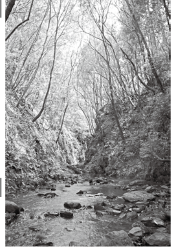
災害の防止や水源のかん養など、私たちの暮らしに密接に結びつく西山の森