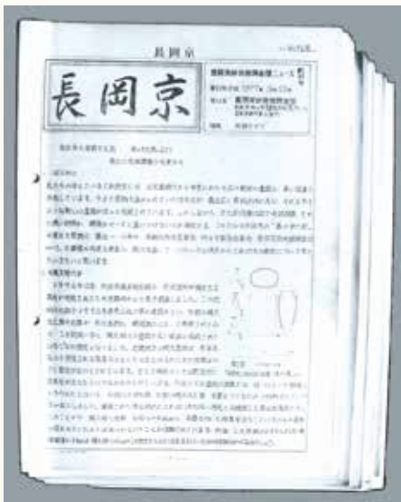
長岡京ニュースを発行し、発掘の様子を伝えました

今回の記事に関する資料は、図書館1階歴史資料展示コーナーで展示しています。(3月末日まで。図書館休館日を除く)