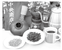
「生豆で楽しむコーヒー講座」など、魅力的な講座がたくさん!

☎長岡中央商店街事務局(文京堂書店内) ☎953-0225 長岡市商工会 ☎951-8029