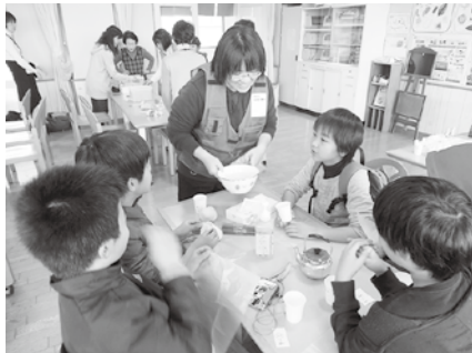
人気の体験型講座「サバイバル飯作り」。通称「サバ飯」。ビニール袋で炊くだけ。後片付けが簡単で、節水にもなります。

常設後、普段は「災害に強いまちづくり」のために活動しています。地域住民や、自治会など市民のみなさんへの出前講座に出向き、防災意識の啓発活動を行っています。災害時の支援だ