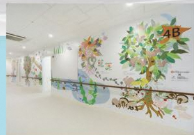
小児科病棟ホスピタルアート

京都済生会病院は、1929年に京都市北区に50床の病院として開設され、1983年に長岡京市に移転、2022年には同市内に新築移転しました。いままでも、これからも、乙訓地域の医療機関や福祉施設等と連携しながら、「出産」から「みとり」まで暮らしに寄り添う病院として地域のまちづくりに貢献します。